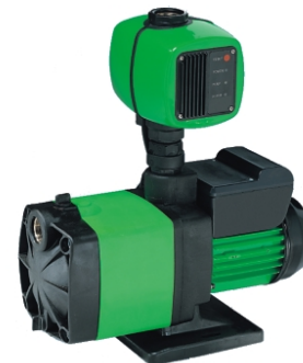
Pumpe Kreisel 4/1000