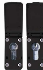
Doppelschließung (Optional) Selbsttätig schließend, inkl. 1x Dreikantschloss und 1x vorgefertigt für PHZ 10/30