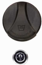
Zylinderschloss (Optional) Ausführung einfach