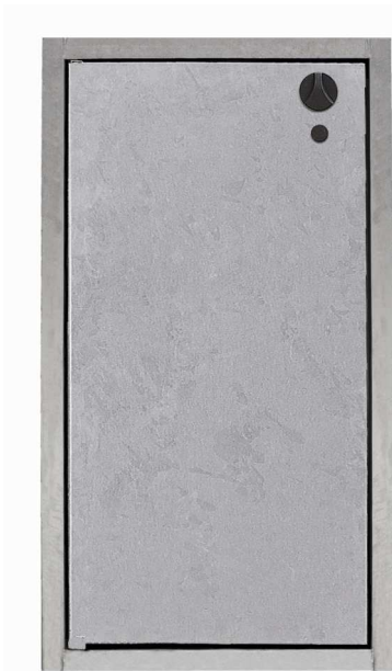
Stahl (Stückfeuerverzinkt nach DIN EN ISO 1461)