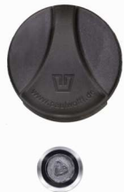
Dreikantschloss (Optional) Ausführung 8mm