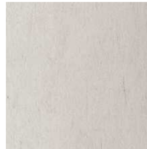
Sichtbeton (Schalungsglatter Beton, Rücken geglättet)