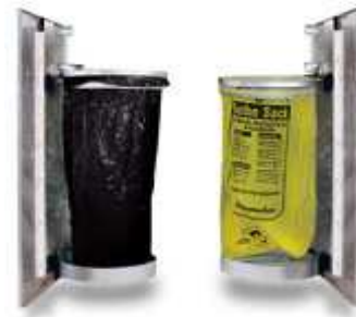
Halterung (Optional) für Kunststoff- oder Papiersack, 30 oder 40 cm Durchmesser