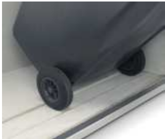
Kippausparung Räderarretierung für alle Abfallbehälter