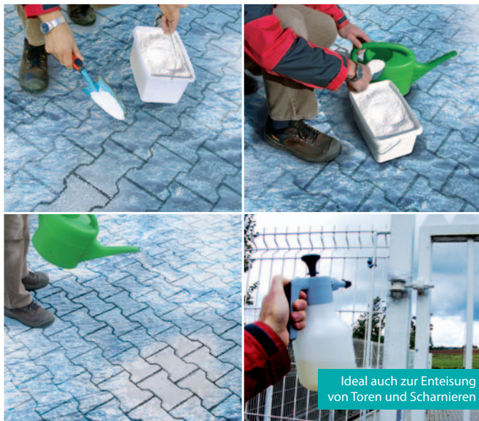
Ideal auch zur Enteisierung von Toren und Scharnieren