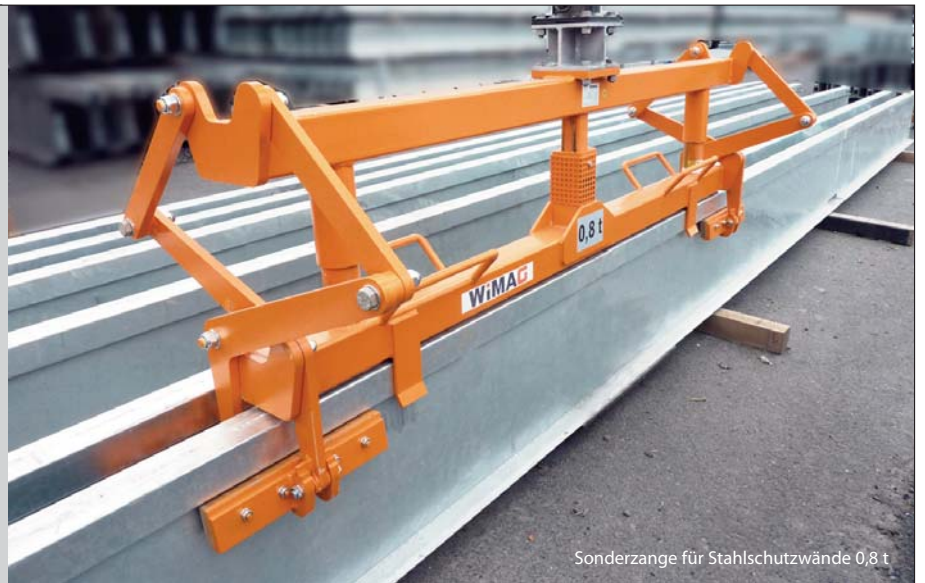
Sonderzange für Stahlstützwände 0,8 t