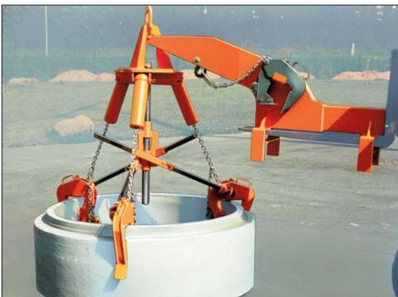
RGA-300 mit Kragarm KA-300 für den automatischen Staplertransport