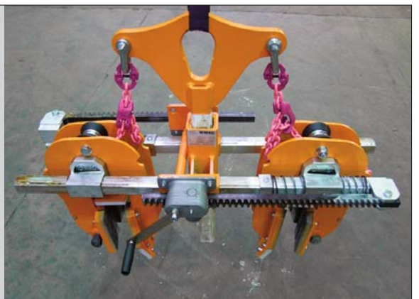
Rohrgreifer RG 3,5 mit gleichzeitiger, stufenloser Einstellung auf die Nennweite über Zahnstangenwinde