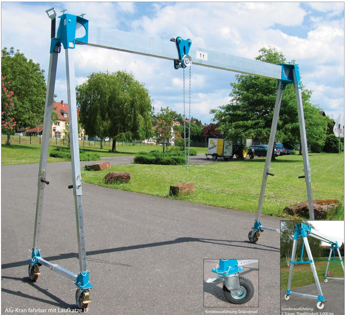
Alu-Kran fahrbar mit Laufkatze LF